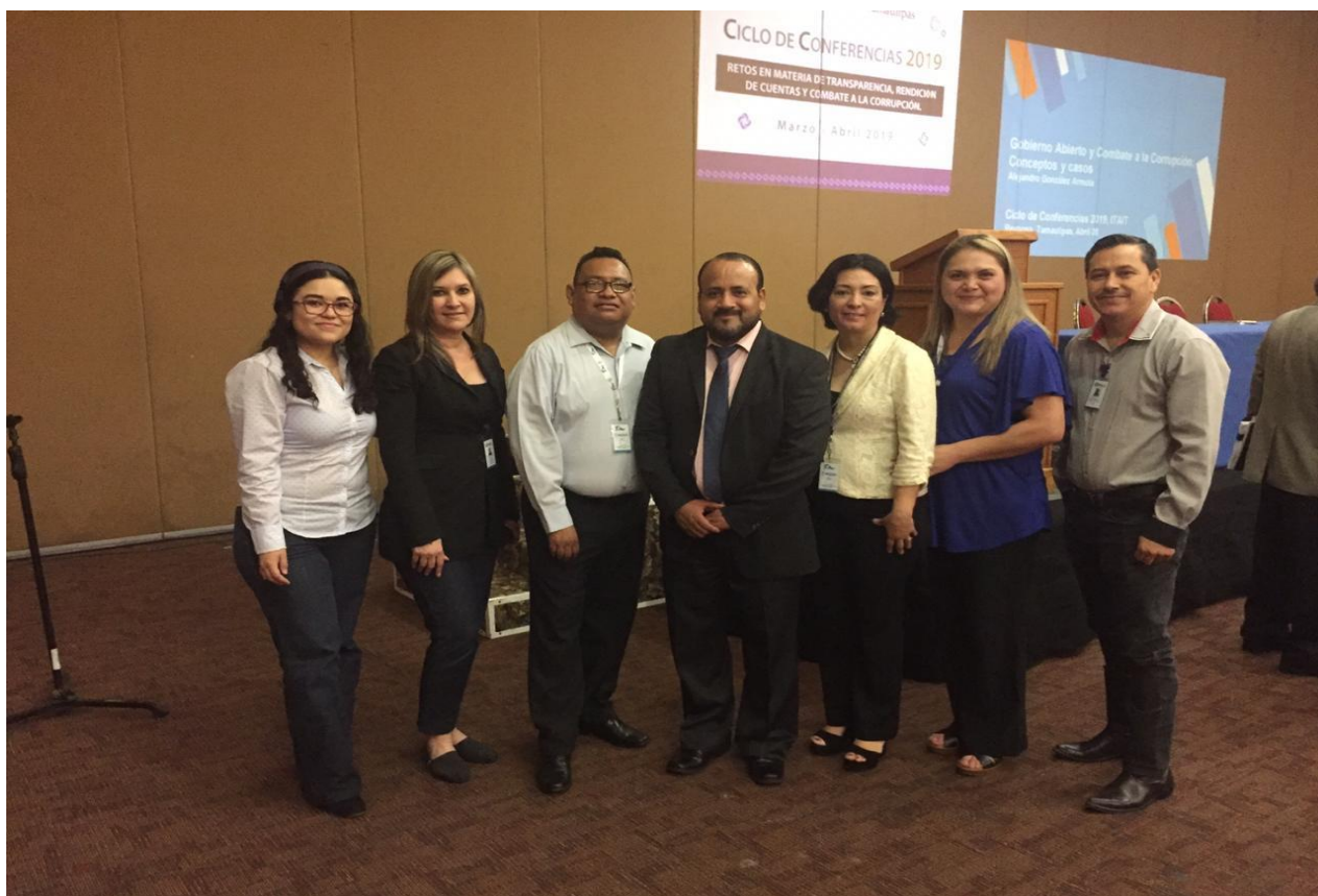
Personal de la COMAPA de Reynosa asiste a conferencias, tocando temas de transparencia, rendición de cuentas y combate a la corrupción.

Con el fin de estar actualizados en las disposiciones legales para cumplir los retos en materia de transparencia, rendición de cuentas y combate a la corrupción, personal de Comapa Reynosa asistió al ciclo de conferencias impartidas por el maestro Alejandro González, en un